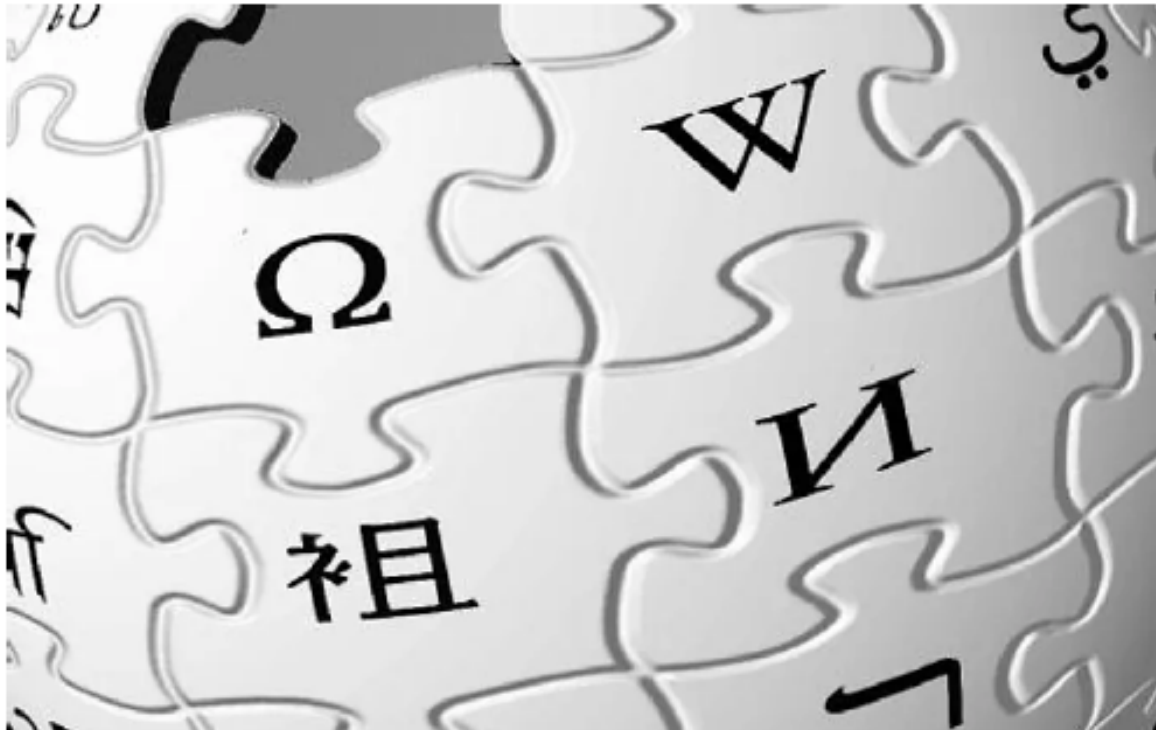
Logotipo de Wikipedia.

Mejorar la entrada de Wikipedia de un municipio puede significar un aumento de hasta un 33% en las estancias hoteleras de ese lugar. Así lo demostró un estudio experimental desarrollado con municipios españoles y publicado este año en el prestigioso Journal of Economics and Management