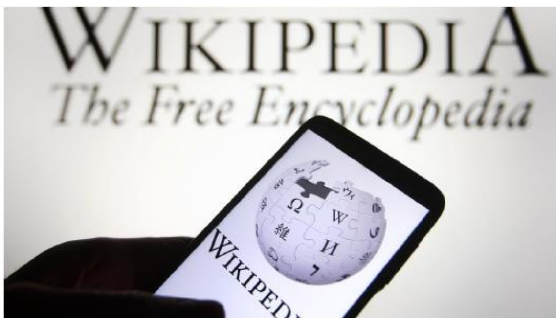
Logotipo de Wikipedia. Pavlo Gonchar

elDiario.es 4 de abril de 2022 - 19:04h □ 0